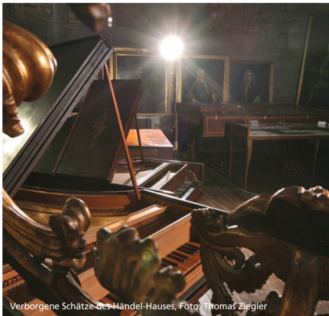
Verborgene Schätze des Händel-Hauses, Foto: Thomas Ziegler

Die Lange Nacht der Wissenschaften findet am 3. Juli 2026 ab 18:00 Uhr im Händel-Haus und in zahlreichen weiteren Einrichtungen in der Stadt Halle statt. Das genaue Programm wird ab Mai 2026 auf der Website www.Indwhalle.de bekannt gegeben. Der Eintritt ist frei.