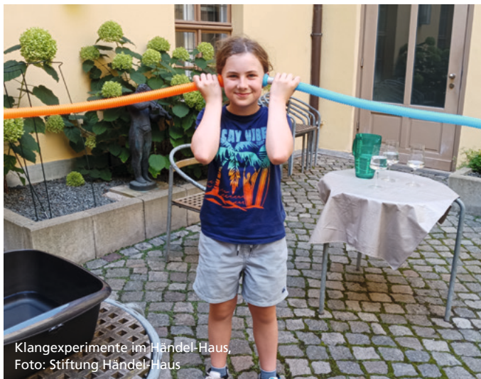
Klangexperimente im Händel-Haus

Dauer: ca. 50 min, Tickets: Kinder: 2 €, begleitende Erwachsene: Museumseintritt, Treffpunkt: Museumskasse. Voranmeldung unter Tel.: 0345 500 90-103 oder E-Mail: ticket@haendelhaus.de