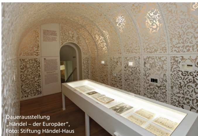
Dauerausstellung „Händel – der Europäer“, Foto: Stiftung Händel-Haus