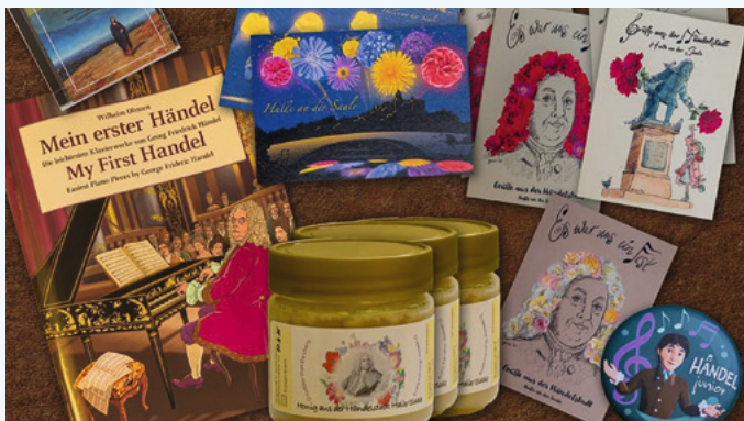
Eine Auswahl der neuen Souvenirs und Geschenkideen im Museumsladen des Händel-Hauses