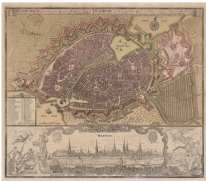
Das besondere Exponat: Hamburg, Stadtplan und -ansicht, Kupferstich von Matthäus Seutter, um 1750 (Inventarnummer: BS-IIb 9)

Bei dem eher selten gespielten Werk Meisters handelt es sich um zwei Triosonaten, die vielleicht sogar – um ihrem Titel gerecht zu werden – in einem Lustgarten aufgeführt wurden. Der Erstdruck erfolgte 1695 in Hamburg, wo es seinerzeit sogar einen Lustgarten gab. In Hamburg wiederum verbrachte mehr als ein halbes Jahrhundert später der zweitälteste Bach-Sohn Carl Philipp Emanuel einen beträchtlichen Teil seiner Karriere. Von ihm erklingt ebenfalls eine Triosonate mit programmatischer Überschrift: