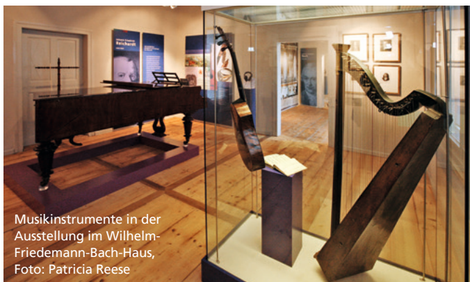
Musikinstrumente in der Ausstellung im Wilhelm-Friedemann-Bach-Haus

Als eines der bedeutendsten Renaissancehäuser der Stadt Halle war das Wilhelm-Friedemann-Bach-Haus in der Großen Klausstraße Wohnstätte des ältesten Sohnes von Johann Sebastian Bach. Die Dauerausstellung in dem nur 300 Meter vom Händel-Haus entfernten Gebäude widmet sich dem Leben und Wirken berühmter Hallescher Komponisten aus fünf Jahrhunderten. Besucherinnen und Besucher erfahren Wissenswertes über Wilhelm Friedemann Bach (1710–1784) als eine der wichtigsten Persönlichkeiten der Stadt sowie über weitere Komponisten aus der Musikgeschichte, u. a. Samuel Scheidt (1587–1654), Georg Friedrich Händel (1685–1759), Johann Friedrich Reichardt (1752–1814), Carl Loewe (1796–1869) und Robert Franz (1815–1892). An Medienstationen sind Musikstücke der Komponisten zu hören. Neben Notenerstdrucke und Faksimiles sind historische Musikinstrumente ausgestellt. Zwei Räume informieren über die Hausmusik in Halle. Über die Musikerstätten in Halle gibt ein großformatiger Stadtplan Auskunft. Prunkstück ist eine historische Bohlenstube mit Resten von Wandmalereien (Blumenmotive) aus dem 16. Jahrhundert im ältesten Teil des Gebäudekomplexes.