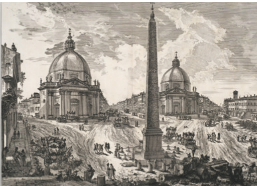
Piazza del Popolo, aus Vedute di Roma von Giovanni Battista Piranesi, ca. 1750