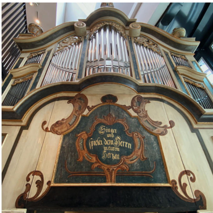
Orgel von Johann Gottlieb Mauer, Tegkwitz 1770 (MS-639)

Museumseintritt: 7,50 €, erm. 5,00 €. Bitte beachten Sie, dass die Teilnehmerzahl begrenzt ist. Anmeldung erwünscht unter Tel. 0345 500 90-103. Reservierte Karten bitte bis 15 Minuten vor Veranstaltungsbeginn abholen. Danach gehen diese in den freien Verkauf.