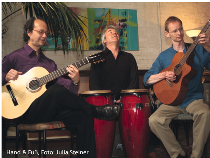
Hand & Fuß

HINWEIS: Tickets (15 €) sind im Vorverkauf über www.haendelhaus.de und an der Museumskasse erhältlich. Bei schönem Wetter werden am Konzerttag ab 17.00 Uhr zusätzliche Karten freigeschaltet. Vorverkaufsstart: 16. Juni 2026.