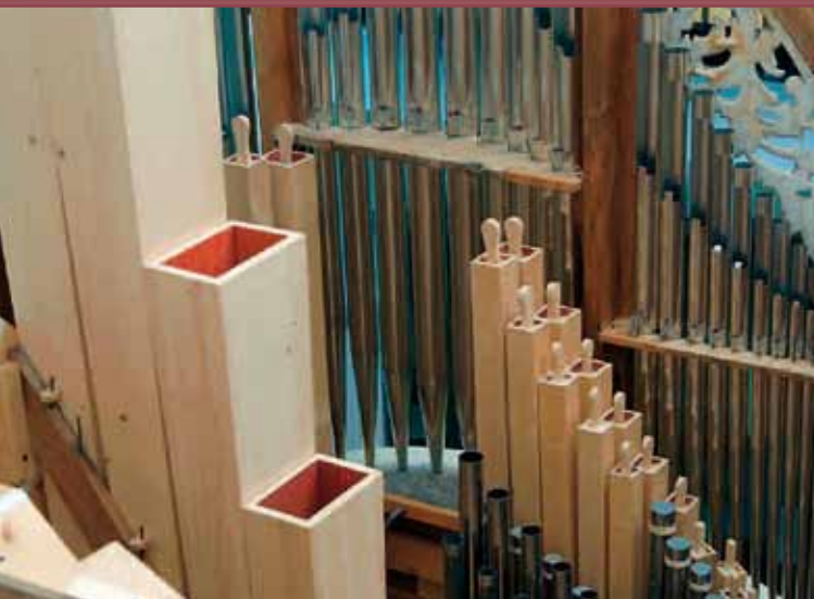
Blick in die Johann-Gottlieb-Mauer-Organ