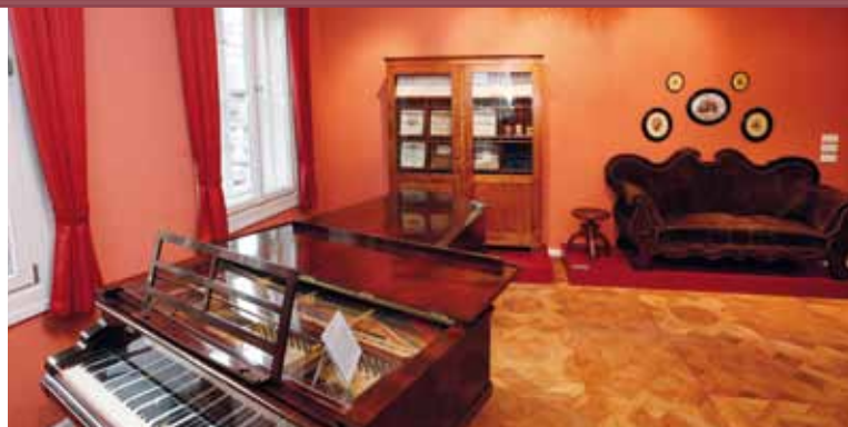
Salon «Robert Franz» im Wilhelm-Friedemann-Bach-Haus

Hinter diesem klangvollen Namen verbirgt sich eine Neuerwerbung der Stiftung Händel-Haus. Bei dem Musikinstrument handelt es sich um eine Walzen-Drehorgel, wie sie noch vor einem Jahrhundert tausendfach das Straßenbild akustisch bereicherte. Die gleichnamige Familiendynastie – Bacigalupo (italienische Einwanderer) – produzierte von 1870 bis 1975 im Prenzlauer Berg (heute Stadtteil von Berlin) fast ausschließlich Instrumente für Bettler, die damit über die Berliner Hinterhöfe zogen, um so ein wenig Geld zu verdienen. Nun wird eine originale «Bacigalupo» die Besucher des Händel-Hauses erfreuen und – gemeinsam mit einem ebenfalls angekauften Pneuma-Jazz-Orchestrion – regelmäßig im Rahmen von Veranstaltungen und Führungen angespielt werden.