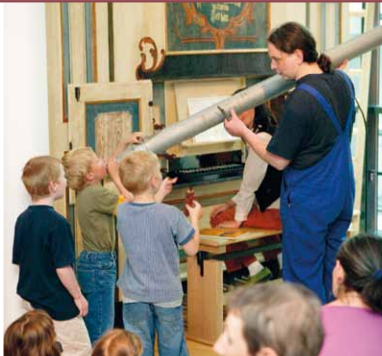
Führung für Kinder durch die Musikinstrumenteausstellung

Möchten Sie mit Ihrer Schulklasse die Ausstellung besuchen? Dann melden Sie sich an unter • karl.altenburg@haendelhaus.de • Telefon: (0345) 50090-219 ► Seite 4