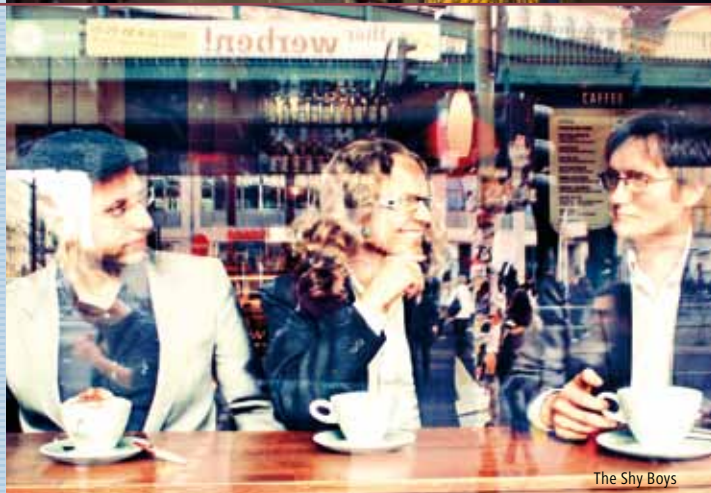
The Shy Boys