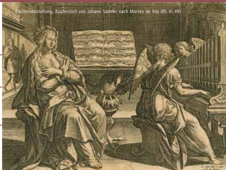
Cäcilienarstellung, Kupferstich von Johann Sadeler nach Marten de Vos (BS VI, 49)

Magische Orte Ferienworkshop für Kinder von 7 bis 12 Jahren Kursgebühr [2] • 25,00 €/Kind inkl. Betreuung und Material ► Seiten 10 und 23