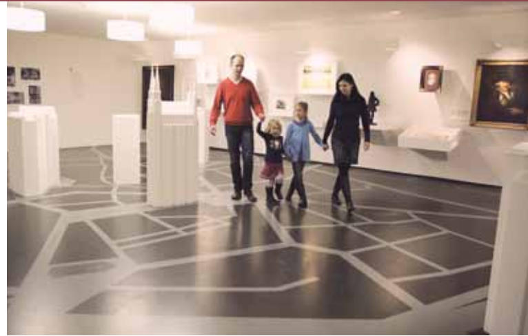
Dauerausstellung «Händel – der Europäer» im Händel-Haus

Versäumen Sie ebenso nicht die Aufführung des «Foundling Hospital Anthem» beim Abschlusskonzert der Händel-Festspiele am 12. Juni 2016 in der Galgenbergschlucht. Beginn ist um 21 Uhr. ► Seite 20