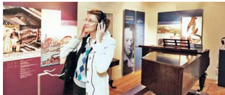
Dauerausstellung «Musikstadt Halle» im Wilhelm-Friedemann-Bach-Haus

In der Ausstellung historischer Musikinstrumente begeben sich die Besucher auf einen spannenden chronologischen Streifzug durch die Geschichte und Entwicklung der Musikinstrumente von der Barockzeit bis zur Gegenwart. Ausgewählte Exponate kann man selbst spielen.