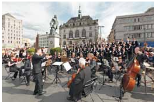
Feierstunde am Händel-Denkmal 2015