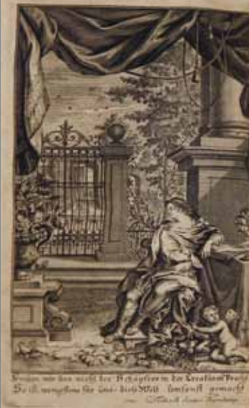
«Irdisches Vergnügen in Gott», Innentitel 1. Teil, Hamburg 1732

Podium junger Talente – Schuljahresabschlusskonzert Veranstalter: Konservatorium «Georg Friedrich Händel» Tickets [2] • 6,00 € • ermäßigt 4,00 € (an der Abendkasse)