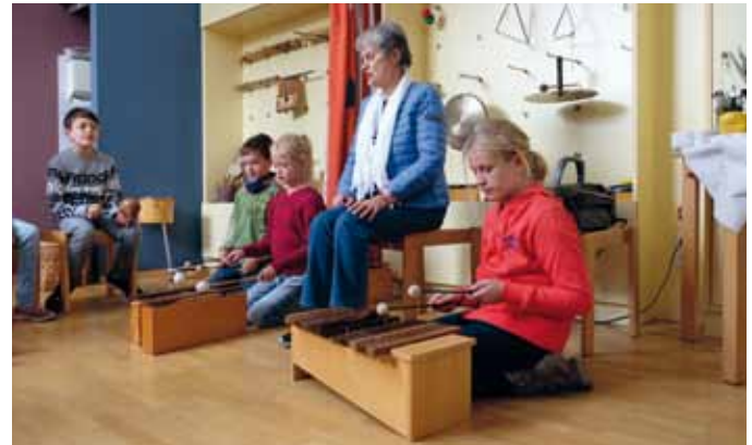
Schallspiele im Händel-Haus

Bis zum 31. Mai 2019 können Interessenten für die Saison 2019/20 ein Abonnement beantragen, das vier Veranstaltungen in zweimonatigem Abstand umfasst. Anmeldeformulare gibt es ab 25. April 2019 an der Museumskasse des Händel-Hauses oder im Internet unter ► www.haendelhaus.de/de/hh/veranstaltungen/vortraege/seniorenkolleg .