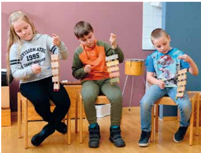
Kinderprojekt «Tamerlano – ein Ausflug in die Welt der Oper»