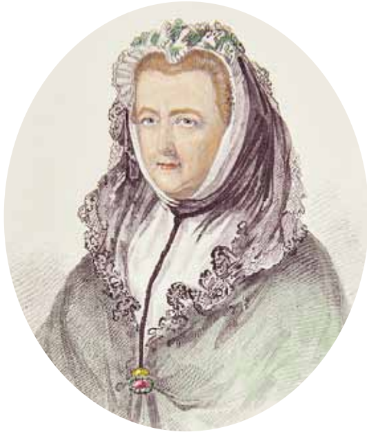
Mary Delany (1700–1788), Roulette von Henry Colburn, 1854, nach einem Gemälde in Hampton Court, um 1750 (Stiftung Händel-Haus BS-III 90a)