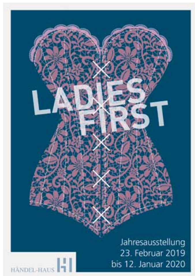
Plakat der Jahresausstellung «LADIES FIRST»

Sie erhalten kostenfreien und flächendeckenden WLAN/WiFi-Internet-Zugang im Innen- und Außenbereich des Händel-Hauses unter «WLAN-Gast». Besondere Zugangsdaten benötigen Sie dafür nicht. Dieser Service wird dank einer Förderung durch das Ministerium für Wirtschaft, Wissenschaft und Digitalisierung ermöglicht.