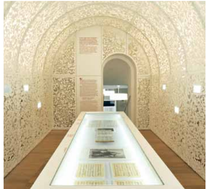
Dauerausstellung «Händel – der Europäer» im Händel-Haus

Bitte beachten Sie ferner auch die «Frauen»-Veranstaltungen des Jahres in anderen Institutionen Halles. Diese sind in der eigenständigen Publikation «Frauenjahr Halle 2019» aufgelistet, erhältlich u. a. im Händel-Haus.