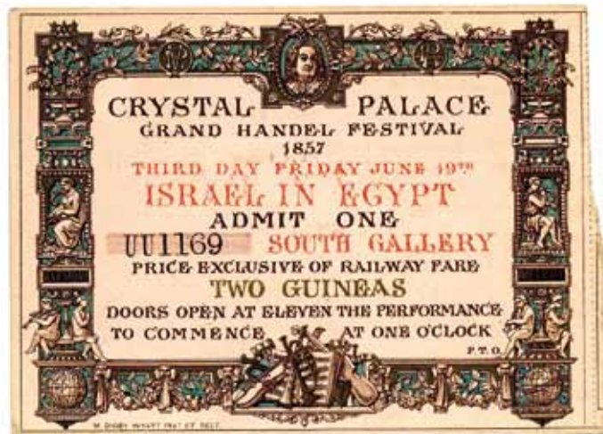
Eintrittskarte «Israel in Egypt». London: Handel Festival, 1857

Karte «Schlüsselbund Hallesche Museen» erhältlich in den beteiligten Museen Aktion vom März 2019 bis 29. Februar 2020